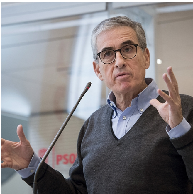
El eurodiputado socialista Ramón Jáuregui