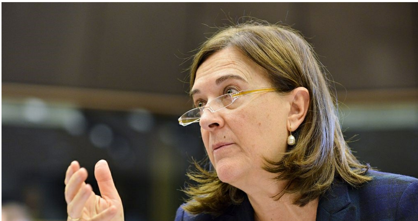
La eurodiputada socialista, Inés Ayala