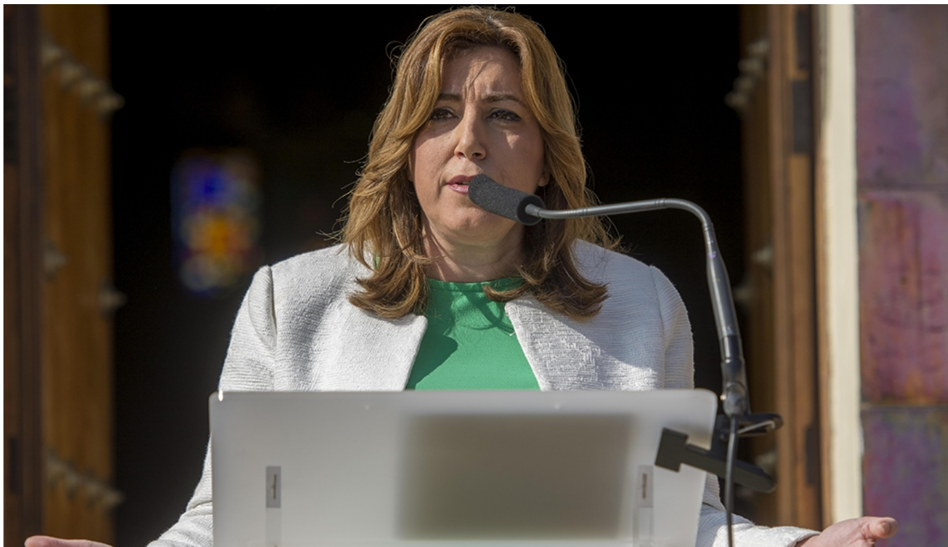
La presidenta de la Junta de Andalucía, Susana Díaz, durante su intervención

La presidenta de la Junta, Susana Díaz, ha destacado que la reforma del Estatuto de Autonomía para Andalucía del año 2007 ha sido "el cinturón de seguridad de los andaluces para hacer frente a la crisis y que los ciudadanos estuvieran blindados en sus derechos y en sus libertades". Díaz ha señalado, en su discurso durante el acto de conmemoración del X aniversario de esta reforma estatutaria, celebrado en la Casa de Blas Infante, que "hace 10 años, cuando se toma una decisión política de reformar el Estatuto del 28 de Febrero y prepararlo para una época distinta, seguramente aquellos ponentes no se imaginaban que ese Estatuto iba a servir para blindar el Estado del bienestar, porque ni siquiera imaginaban la virulencia de la crisis económica a la que nos íbamos a tener que enfrentar". Sin embargo,