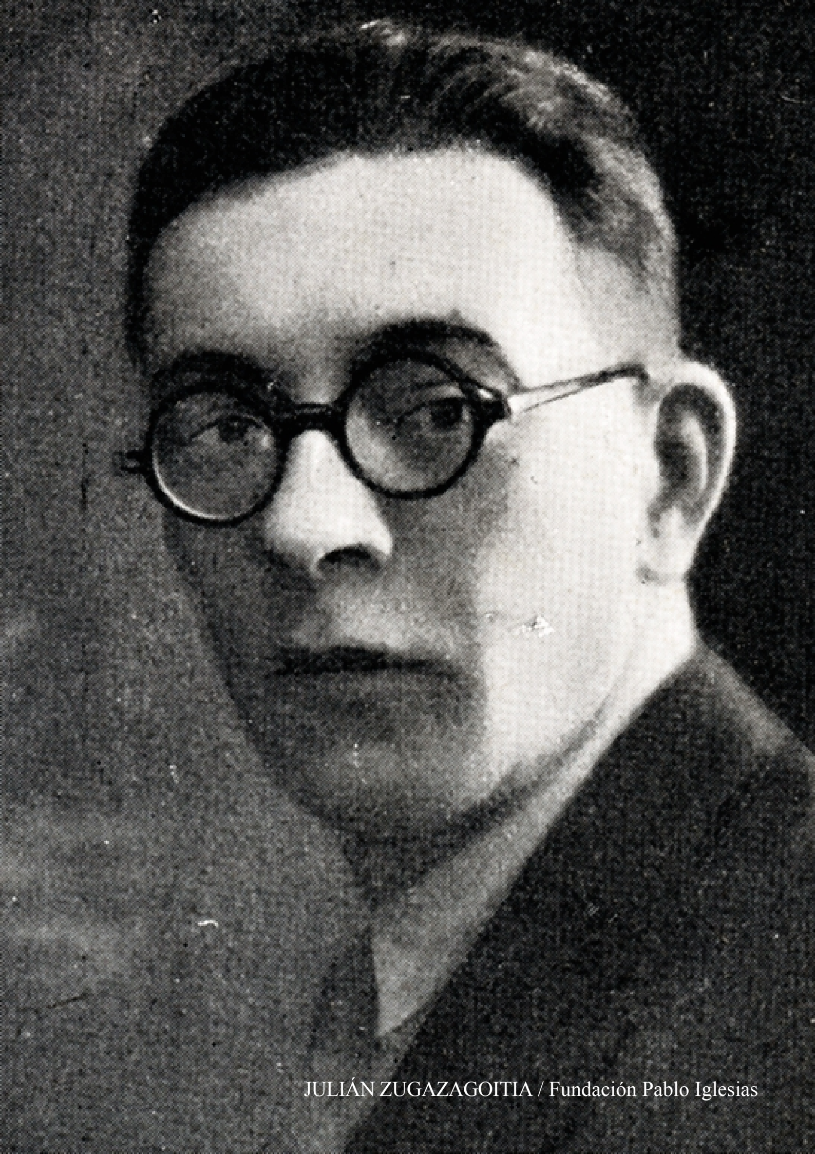
JULIÁN ZUGAZAGOITIA / Fundación Pablo Iglesias