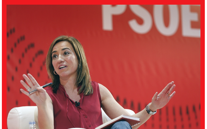
La exministra de Defensa, la socialista Carmen Chacón

La exministra de Defensa Carmen Chacón ha recordado que Europa "no nació solo por la democracia y por las libertades, sino por la igualdad y la cohesión social, y eso es lo que hoy está en riesgo y lo estará en los próximos años por el auge de los populismos xenófobos y por la victoria de Donald Trump". Chacón se ha mostrado "feliz" de visitar Valencia en un "momento clave". "Que estemos haciendo un debate de ideas donde la sociedad civil ha