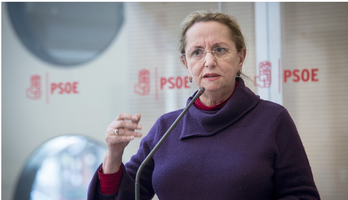
La consejera de Estado, Amelia Valcárcel, durante la rueda de prensa