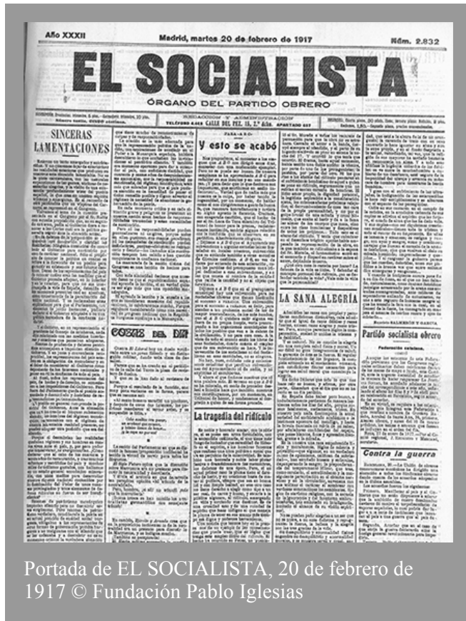
Portada de EL SOCIALISTA, 20 de febrero de 1917

Estamos un tanto amargados y entristecidos. Y no queremos dejar de exteriorizar las realidades exteriores que producen en nosotros esta situación lamentable. No es la pista carnavalesca, con las naturales expansiones de las gentes, ansiosas de necesarias alegrías, y la visión de una existencia profundamente triste del pueblo español, la que crea en nuestro espíritu tristeza y amarguras. Es el recuerdo de otra pantomina que en vísperas del Carnaval se representó en el Congreso. Volvemos al tema de la cuestión presentada en el Congreso por el Sr. Rodés con aquella proposición que, en su segundo...